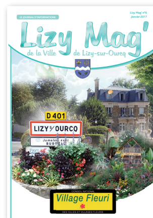
Lizy Mag n°6 2016 Nombre d'exemplaires : 2000 Publication : Dépôt légal en cours Reproduction même partielle interdite