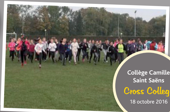
Collège Camille Saint Saëns Cross College 18 octobre 2016