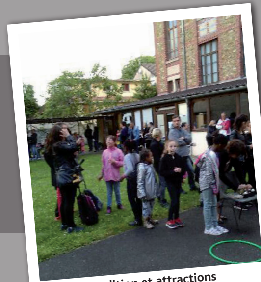
Tradition et attractions Kermesse Annuelle Le 17 juin 2016

Malgré le temps morose et la fraîcheur, les enfants ont pu s'amuser. Hélas, le mauvais temps a freiné la participation des familles, et a obligé l'annulation du spectacle des enfants.