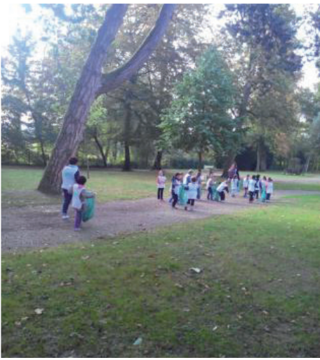
Les écoles de Lizy-sur-Ourcq ont participé à « Nettoyons la Nature » le 29 septembre 2016