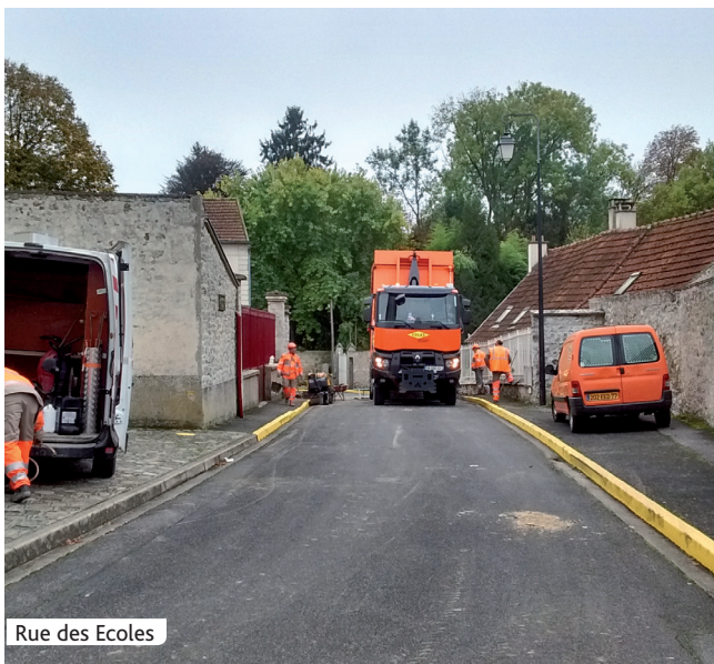
Rue des Ecoles