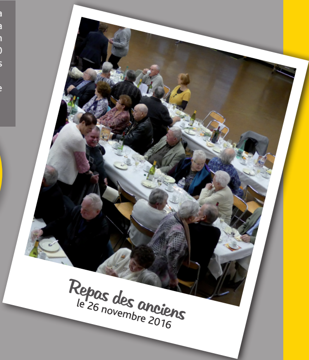
Repas des anciens le 26 novembre 2016