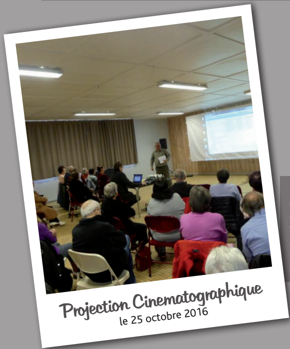
Projection Cinématographique le 25 octobre 2016

Le cross du collège Camille Saint Saëns s'est déroulé le mardi 18 octobre au stade municipal de Lizy-sur-Ourcq sous un temps ensoleillé et propice aux performances des élèves. L'implication de tout le personnel de l'établissement et l'aide précieuse des parents d'élèves ont permis un bon déroulement de cette manifestation annuelle. La matinée a été consacrée aux élèves de sixième et de cinquième qui ont courageusement relevé le défi de courir deux kilomètres cent alors que nos élèves de quatrième et de troisième se sont lancés sur un circuit de deux kilomètres cinq cents. Chaque course s'est déroulée dans une bonne ambiance et sous les encouragements de leurs camarades. Les élèves ont du se surpasser et fournir un effort constant pour réaliser la meilleure performance possible ! Il aura fallu moins de huit minutes aux plus rapides pour terminer le circuit et monter sur le podium sous les applaudissements de leurs camarades. La participation et la bonne humeur des élèves ont permis de faire de cette journée une véritable réussite. L'aventure s'est poursuivie pour les volontaires du cross district à Crécy la Chapelle.