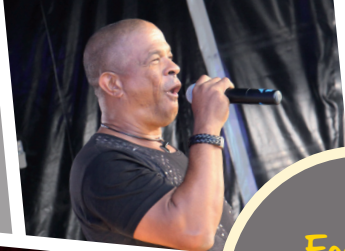
Foire de Lizy-sur-Ourcq le 1 er et 2 octobre 2016