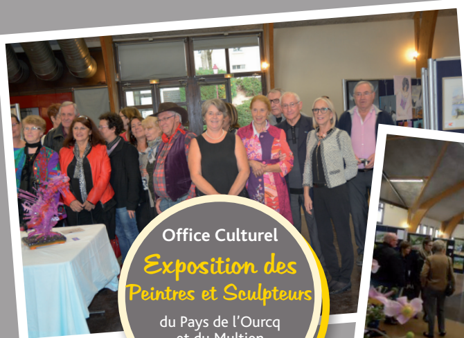
Office Culturel Exposition des Peintres et Sculpteurs

du Pays de l'Ourcq et du Multien 8 et 9 octobre 2016