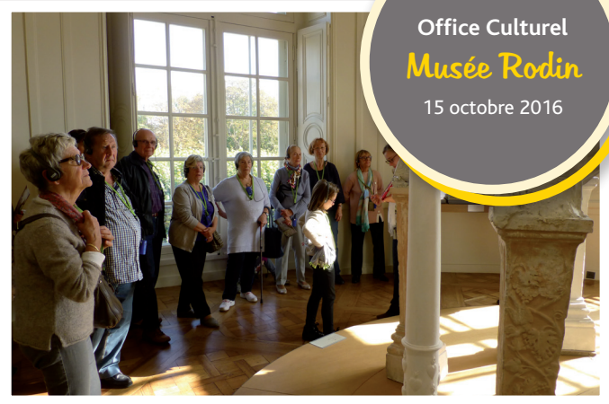
Office Culturel Musée Rodin 15 octobre 2016