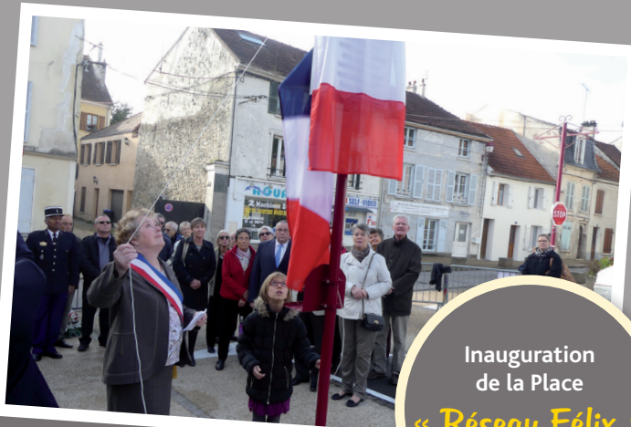
Inauguration de la Place « Réseau Félix »

La Municipalité a rebaptisé la Place du Marché avec une cérémonie au cours de laquelle a été dévoilée la plaque en mémoire des Lizéens qui combattirent l'occupant pendant la deuxième guerre mondiale au sein du Réseau Félix.