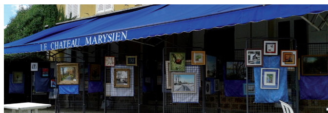
Tout d'abord, notre participation à la manifestation « à l'Asso des Bords de Marne » :

Voici quelques une de nos réalisations exécutées en 2016 :